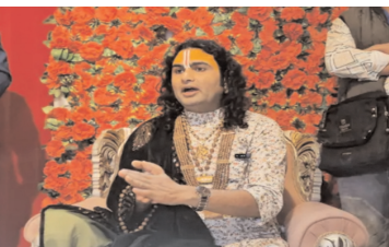
केसरिया हिंदुस्तान विक्रम वाली बुलंदशहर