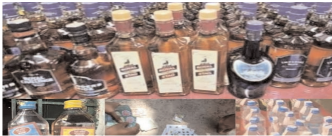
जयपुर हड़बे पर सुल्तानपुर जोड़ के एक ढाबा संचालक के पास से अग्रेजी शराब का बड़ा जखीरा जल कर आरोपी को गिरफ्तार किया गया था। इस वारदात के बाद आबकारी विभाग का अमला ने पुलिस के साथ संयुक्त अभियान चला कर अवैध शराब के अड्डों पर दबिश देने की बात कही थी। पर आबकारी अमला ने