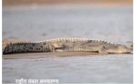
राष्ट्रीय चंबल अभयारण्य

शुपुर। वन्य जीवन से समृद्ध मध्यप्रदेश बाघ प्रदेश, चीता प्रदेश, तेंदुआ प्रदेश के साथ अब घड़ियाल प्रदेश भी है। यहाँ गिद्धों का आदर्श रहवास है। देश में घड़ियालों की संख्या 3044 है और उसमें से मध्यप्रदेश में 2456 है। इस प्रकार देश में 80 प्रतिशत से अधिक घड़ियालों का घर है मध्यप्रदेश। यहाँ पर डॉल्फिन का भी रहवास है। मध्यप्रदेश में अथक प्रयासों से घड़ियालों के संरक्षण का कार्य किया गया। उनके प्राकृतिक रहवास को सुरक्षित बनाया गया और अवैध शिकार पर रोक लगायी गयी। साथ ही अवैज्ञानिक मछली पकड़ने के तौर-तरीकों को बंद किया गया। चंबल नदी के 435 किलोमीटर क्षेत्र को चंबल घड़ियाल अभयारण्य घोषित किया गया है। चंबल नदी मध्यप्रदेश, राजस्थान और उत्तर प्रदेश की सीमा पर बहती है। नदी में घड़ियालों की वृद्धि की वजह देवरी ईको सेंटर है। इस सेंटर में घड़ियाल के अण्डे