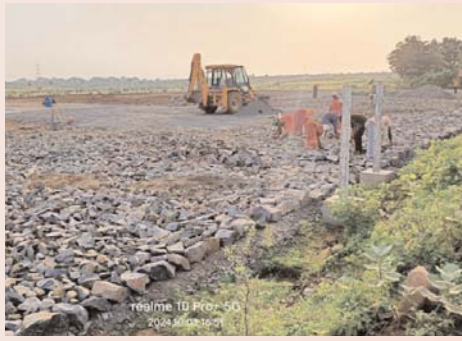
दो माह पूर्व आयुक्त शहडोल संभाग को सौंपी गई लिखित शिकायत में कंपनी पर निष्पक्षता

फर्श से आज तक का सफर बड़े काम समय में तय करने वाला राजू को जेंटलमैन बनाने वाले साहब आखिर है कौन... यह चर्चा जोंरों पर है बताया यह जाता है कि मामूली से चालक से सबके दिलों का खास राजू सिर्फ दिखाने का एक चेहरा है उसके पीछे रिलायंस सीबीएम के अधिकारी अपनी ठेकेदारी कर रहे हैं बताया जाता है कि बड़े पैमाने पर इंटरक बेल से लेकर गाड़ी लगाने के सभी काम अधिकारी अपने खास को देकर ही अपना उद्द अप्रत्यक्ष तौर पर सीधा करते हैं।