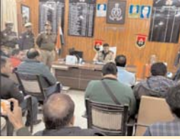
दैनिक केसरिया हिन्दुस्तान अयोध्या मंडल

जिले की कानून व्यवस्था को लेकर पुलिस अधीक्षक सुल्तानपुर ने की अहम घोषणाएं