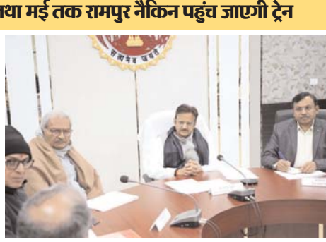
के दोहरीकरण के शेष कार्य की बाधाएं कलेक्टर सतना दूर करें। भू अर्जन से प्रभावितों को शीघ्र मुआवजा वितरित करके निर्माण की बाधाएं दूर कराकर कार्य शुरू कराएं।

के लिए रेलवे द्वारा वन विभाग में 17 करोड़ रुपए जमा करा दिए गए हैं। वन मण्डलाधिकारी 15 दिन की समय सीमा में रेलवे को विभागीय अनुमति जारी कराएं जिससे टेण्डर की कार्यवाही की जा सके। चुरहट के पास सोन नदी पर पुल तथा बहरी के पास गोपद नदी पर पुल एवं 17 प्रस्तावित सुरंगों का निर्माण कार्य तेजी से कराएं। कलेक्टर सीधी भू अर्जन तथा मुआवजा वितरण के सभी प्रकरण सात दिवस में निराकृत कर दें। रेलवे के अधिकारी जमीन का अधिग्रहण मिलते ही तेजी से निर्माण कार्य शुरू कराएं। गोविंदगढ़ से रामपुर नैकिन तक की रेलवे लाइन का गर्मियों में उद्घाटन किया जाएगा। रीवा से सतना रेलवे लाइन