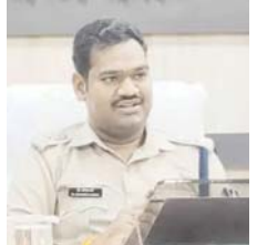
उपयोग करते हुए बैंक व अन्य आवश्यक जानकारी प्राप्त कर 2 टीम गठित कर आगर मालवा म.प्र. व राजकोट गुजरात भेजकर आवेदक के निकाले गये पैसे उसके

दिया कि उसके बैंक खाते से यूपीआईडी के माध्यम से कुल 350000 रूपए फर्जी तरीके से किसी अज्ञात व्यक्ति द्वारा अपने खाते में ट्रान्सफर कर लिया गया है। जो अपने लड़की की शादी के लिए पैसा रखा था। आवेदक की शिकायत पर पुलिस अधीक्षक द्वारा तत्काल साइबर सेल एवं थाना प्रभारी बहरी को फरियादी के पैसे वापस कराने हेतु निर्देशित किया गया जो थाना बहरी पुलिस द्वारा सायबर सेल के माध्यम से तकनीकी एवं भौतिक दक्षता का