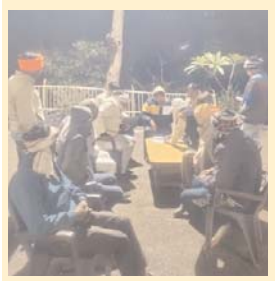
दैनिक केसरिया हिन्दुस्तान

ग्वालियर / ग्रामीणों की राजस्व एवं अन्य विभागों से संबंधित समस्याओं को मौके पर ही निराकृत करने के लिये जिले में दिन के साथ रात्रिकाल में भी शिविर लगाए जा रहे हैं। राजस्व महाअभियान के तहत इन शिविरों का आयोजन हो रहा है। इस क्रम में शुक्रवार को जिले के ग्राम मोहना व मिलावली में शिविर लगाए गए। राजस्व अधिकारियों ने रात्रिकालीन शिविर में राजस्व संबंधी कुछ समस्याओं का मौके पर ही निराकरण कराया तो कुछ समस्याओं के निराकरण की रूपरेखा तय की। शिविरों के माध्यम से खासतौर पर फार्मर आईडी, ई-केवायसी, सीमांकन, बटवारा, अभिलेख दुरुस्ती एवं स्वामित्व योजना इत्यादि से संबंधित समस्यायें हल की गईं। इसके अलावा पीएम किसान पोर्टल पर ई-केवायसी, यू-लेव रिपोर्ट की आधार से लिंकिंग एवं बैंक खाते से आधार लिंक काराकर डीबीटी (डायरेक्ट बेनीफिट ट्रांसफर) का काम भी इस दौरान किया गया। साथ ही नामांतरण, बटवारा व सीमांकन प्रकरणों के निराकरण की रूपरेखा तय की।