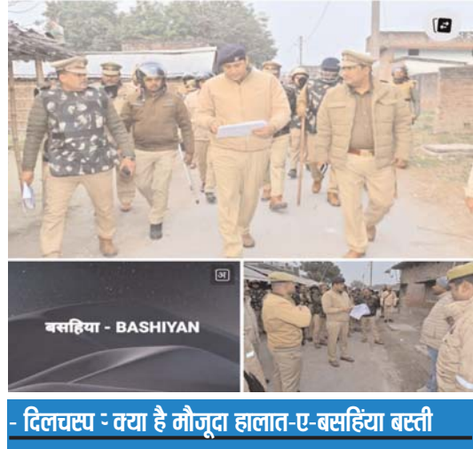
- दिलचस्प - क्या है मौजूदा हालात-ए-बसहिया बस्ती

शामिल जनपद कुशीनगर के ग्राम सभा बसहिया में अल्पसंख्यक व बहुसंख्यक समेत कुल 7 जातियां निवास करती हैं, जिसमें गौर्वी आंकड़ों के मुताबिक सबसे अधिक संख्या कुरैशी वर्ग के लोगों का भी सजा काट रहे हैं। तो कहीं ना कहीं अवैध और गलत कामों में शामिल लोगों में कानून का वेहद खौफ और पुलिसिया कार्रवाई की दहशत से अपनी हरकतों में सुधार के साथ बदलाव की ओर बढ़ रहा है।