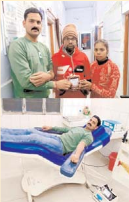
दैनिक केसरिया हिन्दुस्तान अयोध्या मंडल ब्यूरो

समाजसेवी के अग्रार पर खून देकर दो सिपाही ने बर्बाद महिला की जान