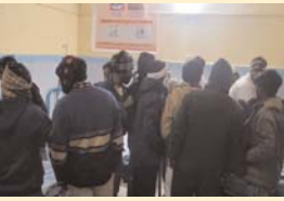
केसरिया हिन्दुस्तान मोहित यादव लख

एटा जनपद में अलीगंज थाना क्षेत्र के पंचदा गांव के समीप दे रात्रि दो बाईकों में आपस में भिड़ंत हो गई। इस दुर्घटना में चार लोग घायल हो गए। घटने की सूचना पर 112 पुलिस को दी गई। पुलिस ने घायलों को एंबुलेंस में सहायता से अलीगंज स्थित सामुदायिक स्वास्थ्य केंद्र में भर्ती करवाया जहाँ चिकित्सकों ने घायलों को प्राथमिक उपचार के बाद गम्भीर रूप से घायल तीन लोगों को हार सेंटर रेफर किया है।