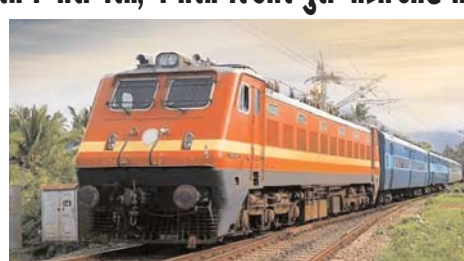
रानी कमलापति, इटारसी, नरसिंहपुर, जबलपुर और कटनी स्टेशनों से होकर गुजरेगी, जहां यात्री इस पर सवार हो सकते हैं। आठ रातों और नौ दिनों की इस यात्रा में वाराणसी, प्रयागराज (महाकुंभ), गंगासागर, कोलकाता

भोपाल। भोपाल से महाकुंभ के साथ वाराणसी, गंगासागर और पुरी यात्रा जाएगी भारत गौरव पर्यटक ट्रेन। यह ट्रेन इंदौर, देवास, उज्जैन, शुजालपुर, सीहोर, रानी कमलापति, इटारसी, नरसिंहपुर, जबलपुर और कटनी स्टेशनों से होकर गुजरेगी मध्य प्रदेश के तीर्थ यात्रियों के लिए इंडियन रेलवे कैटरिंग एंड टूरिज्म कॉर्पोरेशन लिमिटेड (आईआरसीटीसी) द्वारा भारत गौरव पर्यटक ट्रेन का संचालन किया जा रहा है। यह ट्रेन 6 फरवरी 2025 को इंदौर से महाकुंभ के साथ वाराणसी, गंगासागर और पुरी यात्रा के लिए प्रस्थान करेगी। यह ट्रेन इंदौर, देवास, उज्जैन, शुजालपुर, सीहोर,