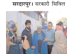
गया की अस्पताल में मरीजों को ठंड से बचने के लिए घर से इतनी व्यवस्था नहीं कर पाते हैं और कुछ मरीज ऐसे हैं जो घर से कमजोर हैं आज इस शीतलहर से बचने के लिए एक मानव सेवा का लाभ मिला