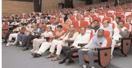
कि वर्ष 2047 तक अपना देश विकसित देशों की श्रेणी में अपनी रूप से शामिल हो। प्रधानमंत्री के इस सपने को साकार करने के लिए मुख्यमंत्री डॉ. मोहन यादव के नेतृत्व में प्रदेश तेजी से आगे बढ़ रहा है।