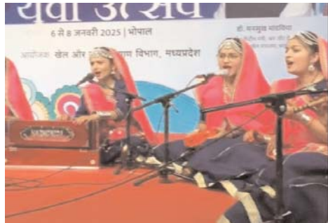
स्तरीय युवा उत्सव के विजेता 10-12 जनवरी को राष्ट्रीय युवा उत्सव में हिस्सा लेंगे। भोपाल में युवा उत्सव का शुभारंभ करते हुए मंत्री विश्वास सारंग ने कहा कि प्रधानमंत्री नरेंद्र मोदी के नेतृत्व में हमारी युवा शक्ति को प्रोत्साहित करने के लिए निरंतर प्रयास हो रहे हैं। आज का युवा न केवल राष्ट्र का वर्तमान है, बल्कि कल का नेतृत्व कर्ता भी है।

भोपाल। मध्यप्रदेश के युवा 12 जनवरी को नई दिल्ली में राष्ट्रीय युवा उत्सव में प्रधानमंत्री नरेंद्र मोदी के सामने अपनी प्रतिभा का प्रदर्शन करेंगे। इस उत्सव में प्रदेश की चुनी हुई टीम हिस्सा लेगी। सोमवार से शुरू हुआ 28वां राज्य स्तरीय युवा उत्सव 8 जनवरी तक चलेगा। इसमें 350 युवा शामिल हैं, जिनमें से विजेता टीम दिल्ली जाएगी। युवा उत्सव की शुरुआत खेल मंत्री विश्वास सारंग ने भोपाल के टीटी नगर स्टेडियम में की। इसका समापन मुख्यमंत्री डॉ. मोहन यादव के मुख्य आतिथ्य में होगा। 7 विधा की प्रतियोगिता शुरू हो गई है। इन विधा में समूह लोक गीत, समूह लोक गायन, पेंटिंग, भाषण, विज्ञान मेला, कहानी लेखन और कविता लेखन शामिल हैं। प्रदेश के 10 संभाग से 350 प्रतिभागी 15 से 29 वर्ष की आयु वर्ग के इस प्रतियोगिता में भाग ले रहे हैं। राज्य