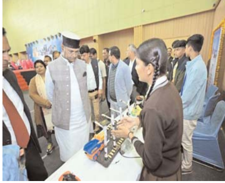
तीन दिवसीय राज्य स्तरीय युवा उत्सव का समापन 8 जनवरी को मुख्यमंत्री डॉ. मोहन यादव के मुख्य आतिथ्य में होगा। समापन समारोह में