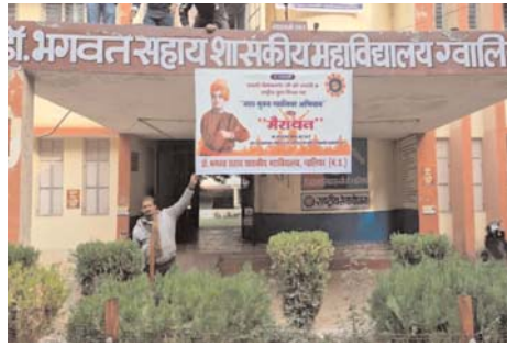
भाग लेने के लिए अब तक 3 हजार के करीब रजिस्ट्रेशन हो चुके हैं। इस मैराथन के बाद भी नशा मुक्त ग्वालियर अभियान के संगोष्ठी, प्रबोधन, शिविर, नुकड़ नाटक आदि कार्यक्रम चलते रहेंगे। तब साल भर बाद ग्वालियर में हम सुखद परिणाम देखने को मिलेगा। कोई भी जन अभियान तभी प्रभावी होता है जब उसमें समाज की सहभागिता होती है और इस अभियान को लेकर समाज भारी उत्साहित है। हमें नशे के खिलाफ चरण बढ़ तरीके से आगे बढ़ना है। सबसे पहले खुद को व्यसन मुक्त, फिर परिवार को व्यसन मुक्त, फिर मोहल्ला को व्यसन मुक्त और फिर ग्वालियर को व्यसन मुक्त बनाना है। जिससे ग्वालियर का व्यसन मुक्त अभियान अंतरराष्ट्रीय

मंगलवार को विवेकानंद सभागार नई सड़क में सामाजिक संगठनों, युवा संगठनों, खेल संगठनों, मातृशक्ति एवं नगर के गणमान्य नागरिकों की बैठक संपन्न हुई। बैठक में दो गई जानकारी के अनुसार 5 किलो लंबी मैराथन दौड़ 12 जनवरी को प्रातः 8.30 बजे से ग्वालियर के जे.सी.मिल स्कूल मैदान से प्रारंभ होकर हजीरा, किला गेट, सेवानगर, फूलवाग होते हुए रानी लक्ष्मीबाई समाधि पर सम्पन्न होगी। इस मैराथन को लेकर समाज के सभी वर्गों में भारी उत्साह है। प्राप्त जानकारी के अनुसार मैराथन में