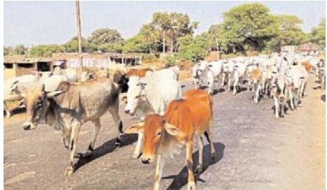
हो जाते हैं। तेंदूखेड़ा क्षेत्र में आज यही स्थिति बनी हुई है। आये दिन बड़ी संख्या में मवेशी सड़क दुर्घटनाओं में काल के गाल में समा चले जा रहे हैं। यही मवेशी खेतों में खड़ी फसलों को अपना निवाला बनायेगे। कृषक भी परेशान होंगे हन सभी समस्याओं से निजात दिलाने की दिशा में तेंदूखेड़ा के

तेंदूखेड़ा इन दिनों तेंदूखेड़ा क्षेत्र में आवारा मवेशियों की समस्याएं फिर सामने आने लगी है। वर्ष भर इन मवेशियों को गुपचुप तरीके से कल खाने चले जाने के साथ सैकड़ों मवेशी बाहन दुर्घटना में असमय काल के गाल में समा जाने के उपरांत वरसात के दिनों में पशुपालकों द्वारा बांधने छोड़ने और चारे भूसा की समस्या के चलते तेंदूखेड़ा तरफ छोड़कर चले जाते हैं। बहुत मवेशियों की सेहत अच्छी देख कुछ मोकामपरत लोग जो ऐसे आवारा मवेशियों को देख आस पास के मवेशी बाजार में जाकर बेंच देते हैं। या कुछ मवेशी जंगली क्षेत्रों में भाग जाते हैं तो कुछ मवेशी बड़े समूह झुंडों को देख स्वयं शामिल