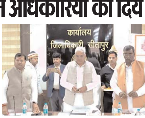
का शिलान्यास, लोकार्पण मा. जनप्रतिनिधियों से कराए, योजनाओं के प्रस्ताव भी जनप्रतिनिधियों से प्राप्त किया जाए तथा प्राप्त प्रस्तावों पर शीघ्र कार्यवाही सुनिश्चित की जाये। जनप्रतिनिधियों द्वारा अवगत करायी गयी जनसमस्याओं का त्वरित निस्तारण सुनिश्चित कराया जाये तथा उन्हें संचालित समस्त योजनाओं की जानकारी भी उपलब्ध करायी जाये। प्रभारी मंत्री ने निर्देश दिये कि जनपद

है। प्रभारी मंत्री द्वारा सैम बच्चों के माता को बच्चों के खान-पान के संबंध में बताया गया। उन्होंने कहा कि माननीय प्रधानमंत्री जी द्वारा जो मोटे अनाजों के प्रयोग पर जोर दिया जा रहा है, इसका सेवन करें तथा फास्ट फूड खाने से बच्चों को बचाएं। प्रभारी मंत्री ने जनपद के 19 सामुदायिक स्वास्थ्य केंद्रों में नवनिर्मित कंगारू मटर केयर वार्ड का वर्युअल लोकार्पण किया। इसके साथ ही जनपद के विभिन्न विकास खंडों के 52 गांवों में ग्राम पंचायत स्तर पर बनायी गयी हाईटेक लाइब्रेरी का भी वर्युअल लोकार्पण किया। प्रभारी मंत्री ने बैठक में उपस्थित सभी अधिकारियों को निर्देशित करते हुए कहा कि सभी अधिकारी शासन की योजनाओं का प्राथमिकता के आधार पर क्रियान्वयन सुनिश्चित करें। उन्होंने कहा कि जनप्रतिनिधियों और अधिकारियों के बीच संवाद और सम्बन्ध बेहतर रहे, योजनाओं