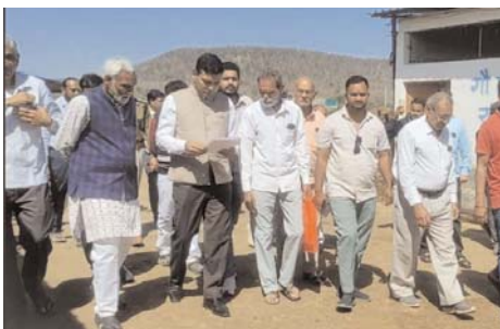
गए कि आप गौशाला का अच्छा संचालन करें। तहसील में पहुंचने

और इसके बाद जमुनिया गौशाला में पहुंचे इसका साफ सफाई का निरीक्षण किया। सिलवानी पहुंचने के ही पूर्व जुनिया उद्यान विभाग का निरीक्षण किया और वहां पर लगे पेड़ पौधों की दुर्दशा को देखते हुए अधिकारियों को निर्देशित किया कि आप पौधों का सही रखरखाव करें और जनता के लिए कौन-कौन से पौधों की आवश्यकता है उनको उपलब्ध कराये। सर्वोदय पशु संरक्षण समिति जुनियर सिलवानी में गौशाला का निरीक्षण किया और साफ सफाई के लिए निर्देश दिए