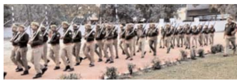
कार्यालय, यूपी 112 पीआरवी, मेस, बैरक, यातायात कार्यालय, आवासीय परिसर आदि का निरीक्षण किया। तत्पश्चात आदेश कक्ष में अर्दली रूम के दौरान संबंधित को आवश्यक दिशा निर्देश दिये गये। गार्ड कमांडर्स व विभिन्न शाखाओं के रजिस्ट्रारों का अवलोकन कर आवश्यक दिशा-निर्देश भी दिए गए। समस्त रजिस्ट्रारों ध्वभिलेखों के