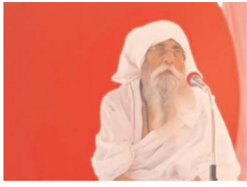
बाबा नहीं बोल रहे हैं, लगता है ये डर गए हैं। बाबा ने कहा, क्रम

और जब आपका कोई दुश्मन नहीं रहेगा तो स्वच्छारी बन जाओगे, फिर कहीं भी घूमो; कहीं भी आओ-जाओ, कोई शंका नहीं कि कोई पीछे से मार देगा, आगे से मार देगा या दूर से मार देगा, तो वही स्वच्छारी हो जाते हैं। दस नली की बंदूक कौन सी होती है? :- कुछ लड़के एक बुजुर्ग आदमी के पास गए और बोले, बाबा, कुछ बताइए, कुछ जान दीजिए। बाबा ने कहा, नहीं। लड़के बोले, आज