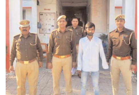
आलाकल (01 अदद फावडा) बरामद हुआ है। अभियुक्त ने पूछताछ में बताया कि उसकी मां एवम् परिवार उसकी उपेक्षा करते थे, उसे घर से अलग दूरसे घर में रहने को दिया गया था। अब मां के द्वारा उस