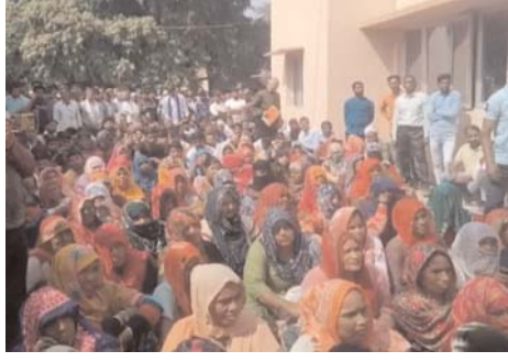
प्रबंधन और विकास के लिए छात्रा जैसे महत्वपूर्ण विषयों पर प्रशिक्षण दिया गया। मनी वाइज वित्तीय सहायता केंद्र के फौलड

वित्तीय साक्षरता सप्ताह 24 से 28 फरवरी तक मनाया जाएगा भारतीय रिजर्व बैंक द्वारा आयोजित वित्तीय साक्षरता सप्ताह 24 से 28 फरवरी तक मनाया जा रहा है। जिसकी थीम वित्तीय समझदारी समृद्ध नारी विषय पर आज राजीविका ऑफिस में राजीविका की महिला सदस्यों के लिए एक विशेष वित्तीय प्रशिक्षण शिविर का आयोजन किया गया। जिसमें उन्हें आर्थिक नियोजन, बचत, जोखिम