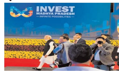
INVEST MADHYA PRADESH INFINITE POSSIBILITIES उम्मीद है। सम्मिट के दौरान खासकर कृषि, प्रदूषण नियंत्रण पर्यटन के क्षेत्र में निवेशकों का ध्यान आकर्षित किया जाएगा। ज्ञात हो कि मध्य प्रदेश में प्राकृतिक संसाधनों की भरमार है और अनेक ऐतिहासिक तथा सांस्कृतिक

मध्य प्रदेश की राजधानी भोपाल में आज यानी 24 फरवरी को इन्वेस्ट मध्य प्रदेश ग्लोबल इन्वेस्टर्स सम्मिट 2025 का आयोजन हो रहा है जिसका उद्घाटन प्रधानमंत्री द्वारा किया गया जो 23 फरवरी को ही मध्य प्रदेश पहुंच गए थे। इस दो दिवसीय कार्यक्रम में मध्य प्रदेश में निवेश के विशाल अवसरों को रेखांकित किया जाएगा और भोपाल को भारत के एक प्रीमियर इन्वेस्टमेंट हब के रूप में उभारने की कोशिश की जाएगी। इस लैंडमार्क कार्यक्रम में दुनिया के 50 से अधिक देशों से प्रतिनिधियों एवं उद्योगपतियों के साथ-साथ कुल 25,000 से ज्यादा भागीदारों के सम्मिलित होने की