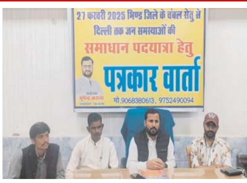
27 फरवी 2025 म्रिण्ड जिले के वंबल सेतु से दिल्ली तक जन समायाओं की समाधान पदयात्रा हेतु पत्रकार वार्ता बेरोजगार नौजवानों को जैसे मुद्दों को लेकर यात्रा प्रारंभ की जा रही है यह प्रमुख मांगें हैं आगामी 27 फरवरी से प्रारंभ होने वाली समाधान पदयात्रा जो कि अपने पास सूत्री मांगों को लेकर प्रारंभ की