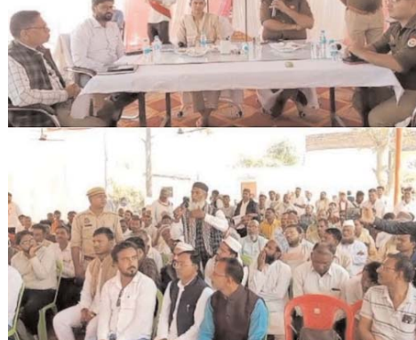
मानने की अपील की। जिला अधिकारी ने सभी को होली दुखड़ा सुनाया। डीएम ने एडीएम को समस्याओं को निस्तार करने के आदेश दिए। वहीं पुलिस से भीड़ लग गई। फरियादियों ने राजस्व से संबंधित समस्याओं का दुखड़ा सुनाया। डीएम ने एडीएम को समस्याओं को निस्तार करने के आदेश दिए। वहीं पुलिस से

दैनिक केसरिया हिंदुस्तान राधेश्याम गुप्ता