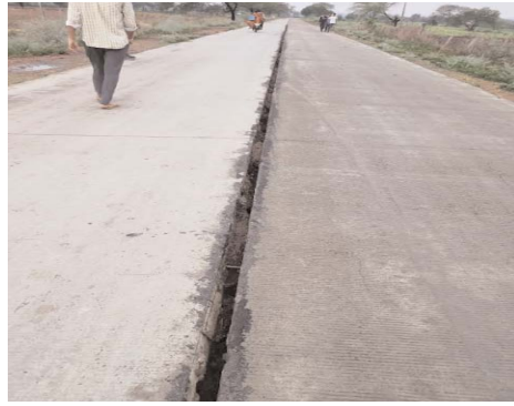
झाड़ियां हो गई हैं जिससे पटलियां दिखाई नहीं देती। स्थानीय निवासी

निर्माण के दौरान ठेकेदार से सहानुभूति पूर्वक कहा भी गया था कि बड़ी मुश्किल से सड़क का निर्माण हो रहा है कृपया गुणवत्ता पूर्ण मार्ग का निर्माण करें किंतु पीडितों की विभाग की हीला हवाली के चलते गुणवत्ता विहीन सड़क का निर्माण किया गया है। दरारों के अलावा जगह जगह से रोड के बीचों बीच से भी दरारें दिखने लगी हैं जो इस बात का अंदाजा दे रही हैं कि मार्ग का निर्माण कितनी गुणवत्ता हीन तरीके से किया गया है, 24 किलोमीटर लंबी सड़क के दोनों साइड की पटलियों पर भी गाजर घास व