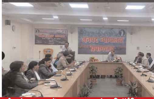
राष्ट्रीय लोक अदालत में कुल 220537 वादों का रिकॉर्ड निस्तारण