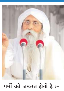
गर्मी की जरूरत होती है :-

गर्म देश हैं, उनमें शरीर को गर्मी से बचाने के लिए इस दिन छुट्टी रखना उचित है। और जो ठंडे देश हैं, उनमें सूरज की गर्मी लेने तथा आराम करने के लिए रविवार को छुट्टी रखना उचित रहता है। तो इसी तरह हर दिन का अलग-अलग महत्व होता है और लोग उसी तरह उसका फायदा उठाते हैं।