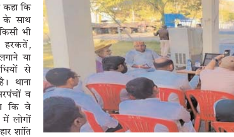
यह भी स्पष्ट किया कि सार्वजनिक स्थानों पर शराब पीकर हड़दंग मचाने, तेज आवाज में डीजे बजाने या अशान्ति

प्रेम का संदेश देता है। उन्होंने कहा कि यह पर्व उत्साह और उमंग के साथ मनाया जाना चाहिए, किंतु किसी भी प्रकार की अशोभनीय हरकतों, अश्लील गाने, जबरन रंग लगाने या हड़दंग करने जैसी गतिविधियों से परहेज करना आवश्यक है। थाना प्रभारी ने बैठक में मौजूद सरपंचों व व्यापारियों से आग्रह किया कि वे अपने-अपने गांव व मोहल्लों में लोगों को जागरूक करें, ताकि त्योहार शांति और सौहार्द के साथ संपन्न हो। उन्होंने