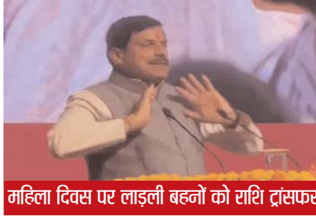
महिला दिवस पर लाइली बहनों को राशि ट्रांसफर

नारी सशक्तिकरण को लेकर जो भी हो सकता है कर रहे: सीएम डॉ. मोहन यादव ने कहा, महिला बाल विकास, पुलिस विभाग और ग्रामीण एवं पंचायत विभाग का संयुक्त आयोजन किया गया। इसमें नई योजनाओं की प्रगति रिपोर्ट पेश